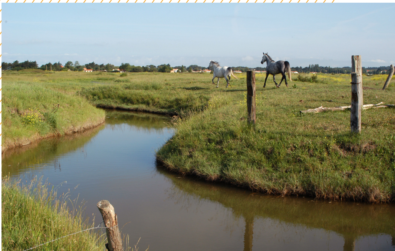
Marais salants des Moutiers-en-Retz

Extension des réseaux sur les secteurs de La Cavernière (Rouans) et de La Durière (Pornic) pour décliner les zonages d'assainissement. Calendrier prévisionnel des travaux : 2022-2024.