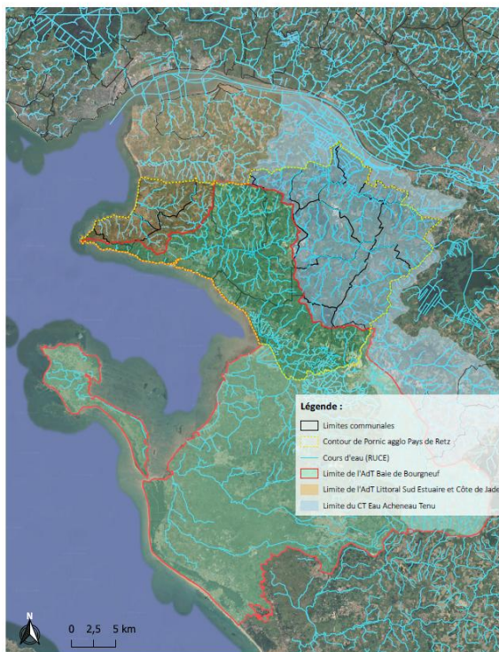
Périmètre de l'Accord de Territoire " Baie de Bourgneuf " (ancien CT Eau) - 2023-2028

Ce contrat définit une stratégie et une feuille de route sur 6 ans ainsi qu'une programmation sur deux tranches de 3 ans, la première tranche 2023-2025 faisant l'objet d'une évaluation pour tenir compte des actions engagées et réorienter la deuxième tranche 2026-2028, si besoin.