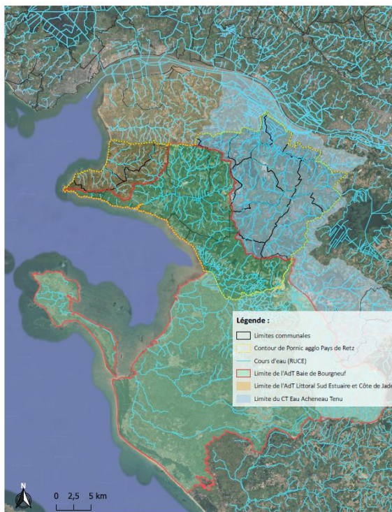
Périmètre de l'Accord de Territoire " Baie de Bourgneuf " (ancien CT Eau) - 2023-2028

Ce contrat définit une stratégie et une feuille de route sur 6 ans ainsi qu'une programmation sur deux tranches de 3 ans, la première tranche 2023-2025 faisant l'objet d'une évaluation pour tenir compte des actions engagées et réorienter la deuxième tranche 2026-2028, si besoin.